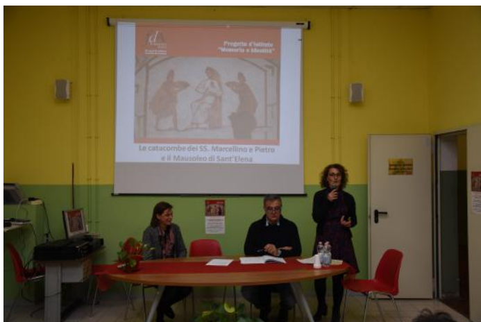
Alcuni momenti dell'incontro

Per partecipare è necessario iscriversi entro il 7 dicembre, segnalando nome, cognome e numero di telefono alla seguente e-mail: memoriaeidentita@gmail.com